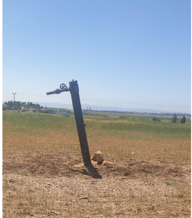
תמונה 1+2 - ארובות קיימות לשימור